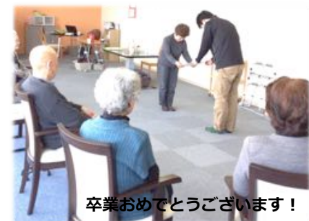
卒業おめでとうございます！