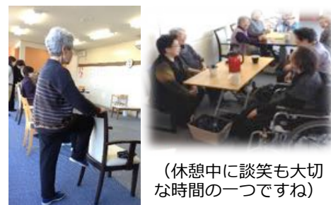
(休憩中に談笑も大切な時間の一つですね)

宮城県登米市の中心街。赤い屋根の可愛らしい外観が目印の「スタジオぷらす登米」は、おかげさまで開所2年目を迎え、毎日元気いっぱい活動中です。スタジオぷらす登米では、デイサービスの「卒業」に向けた取り組みを積極的に行っております。開所から現在までに5名の利用者さんがデイサービスを卒業。利用開始時に掲げた目標を達成し、新たな生活への一歩を踏み出しました。今後は、デイサービスを卒業された方々の「社会参加」を見添えたサポートを強化していきたいと考えております。