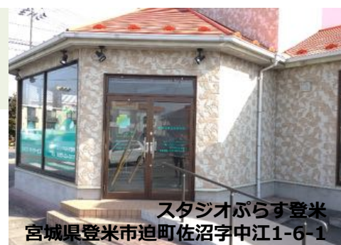
スタジオぷらす登米 宮城県登米市迫町佐沼字中江1-6-1

デイサービスの「卒業」に向けた取り組みを強化 -スタッフ一丸となり卒業後の社会参加を見据えたサポートを-