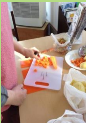
左手での調理練習 (カレー、唐揚げなど)