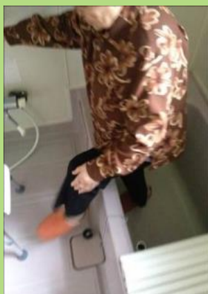
入浴動作・福祉用具確認